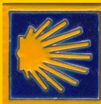
Azulejo galicien XXI ème S Praza do Obradorio Santiago de Compostella

... où vous trouverez des nouvelles de l'association et de notre patrimoine jacquaire.