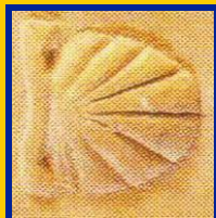
Chapelle confrérie St-Jacques Villefranche XV ème S (détail de chapiteau)