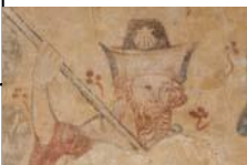
St Jacques, début années 1300.